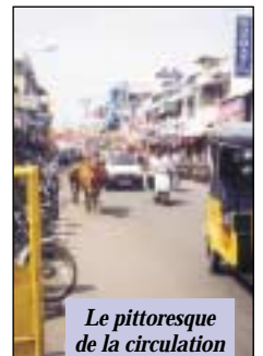
Le pittoresque de la circulation à Pondy